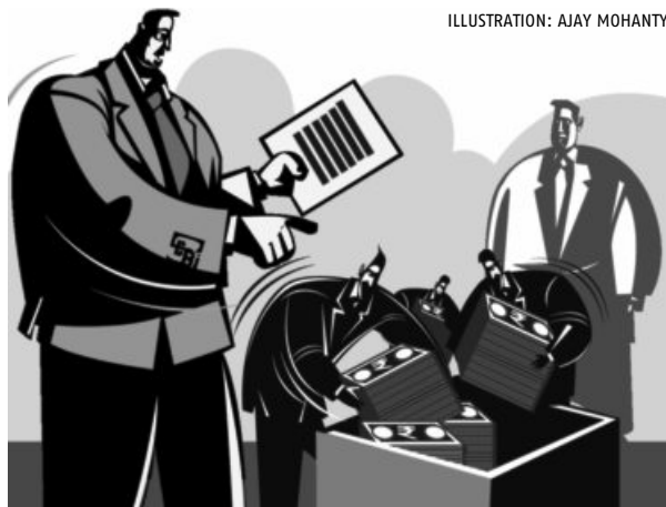
ILLUSTRATION: AJAY MOHANTY

“The Board may communicate its comments, if any, to the merchant banker prior to launch of the scheme and the merchant banker shall ensure that the comments are incorporated in the placement