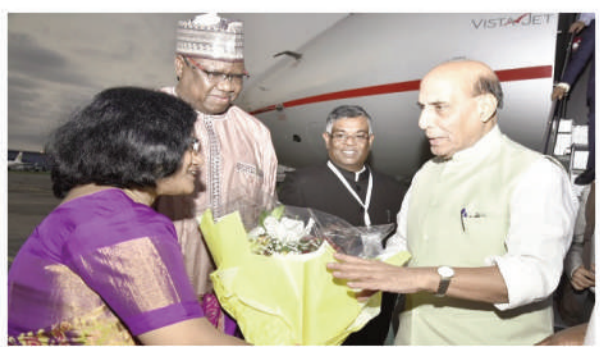
कार्यक्रम में प्रवासी भारतीयों के साथ बातचीत की। भारत की बढ़ती साख के बारे में बात करने पर प्रवासी भारतीय प्रसन्नता से झूम उठे। राजनाथ सिंह ने नाइजीरिया में भारतीय समुदाय के सकारात्मक योगदान की सराहना करते हुए विश्वास व्यक्त किया कि वे भारतीय ध्वज को इसी प्रकार शिखर पर लहराते रहेंगे।

नई दिल्ली, मेट्रो मीडिया। तीन दिन की यात्रा पर नाइजीरिया गए रक्षा मंत्री राजनाथ सिंह ने दूसरे दिन सोमवार को अबुजा में भारतीय उच्चायोग की ओर से आयोजित एक कार्यक्रम में प्रवासी भारतीयों के साथ बातचीत की। इस कार्यक्रम में न केवल अबुजा से बल्कि नाइजीरिया के अन्य शहरों जैसे लागोस से भी भारतीय समुदाय के लोग शामिल हुए। यह किसी भारतीय रक्षा मंत्री की नाइजीरिया की पहली यात्रा है। परिचय अफ्रीकी देश की रक्षा मंत्री की यात्रा को दोनों देशों के बीच दोस्ती के मजबूत बंधन के निर्माण में एक महत्वपूर्ण मील के