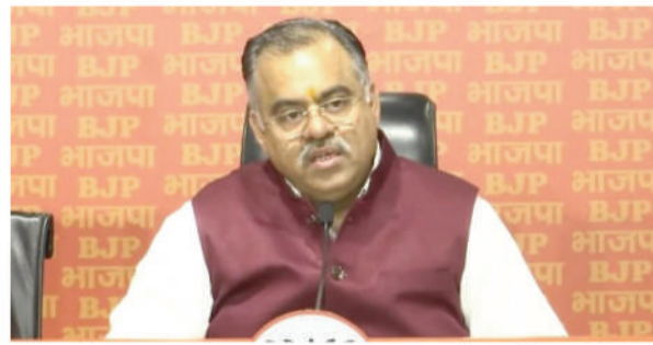
अमित शाह, राजनाथ सिंह, नितिन गडकरी और भाजपा अध्यक्ष जे पी नड्डा सहित पार्टी के अन्य वरिष्ठ नेता भी जनसभाओं को संबोधित कर सकते हैं।

केंद्र में प्रधानमंत्री नरेंद्र मोदी के नेतृत्व वाली राष्ट्रीय जनतांत्रिक गठबंधन (राजग) सरकार के नौ साल पूरे होने के मौके पर भारतीय जनता पार्टी (भाजपा) ने मंगलवार को एक महीने तक चलने वाले जनसंपर्क अभियान की शुरुआत की। इस अभियान के तहत केंद्रीय मंत्री और भाजपा संगठन से जुड़े वरिष्ठ नेता देश भर में विभिन्न कार्यक्रमों में शिरकत करेंगे। भाजपा के इस अभियान को 2024 के लोकसभा चुनावों के महंजन सत्तारूढ़ पार्टी की जनता में