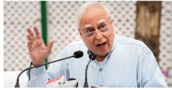
अरब लोगों की सोच व आकांक्षाओं के साथ स्वतंत्रता का विचार "नए भारत" का निर्माण कर सकता है। संयुक्त प्रगतिशील गठबंधन की पहली और दूसरी सरकार के दौरान केंद्रीय मंत्री रहे सिब्बल ने पिछले साल मई में कांग्रेस छोड़ दी थी। समाजवादी पार्टी के समर्थन से सिब्बल राज्यसभा के निर्दलीय सदस्य निर्वाचित हुए थे।

राज्यसभा सदस्य कपिल सिब्बल ने मंगलवार को नए संसद भवन के उद्घाटन को लेकर भाजपा पर कटाक्ष करते हुए कहा कि वह नया या पुराना भारत नहीं बल्कि ऐसा भारत चाहते हैं जहाँ संसद धार्मिक अनुष्ठानों से परे हो, कानून सभी के साथ समान व्यवहार करता हो और धार्मिक आस्थाओं को लेकर नागरिकों की हत्या न की जाती हो। प्रधानमंत्री नरेंद्र मोदी ने उद्घाटन को नए संसद भवन के उद्घाटन को देश की विकास यात्रा में अविस्मरणीय पल करार दिया था। नए संसद भवन की लोकसभा में अपने संबोधन में मोदी ने कहा था कि नई इमारत नई ऊंचाइयों को हासिल करने की दिशा में काम करने के लिए नए भारत की आकांक्षाओं