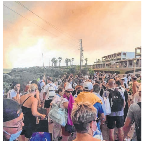
Tourists are evacuated from hotels during a wildfire on the Greek island of Rhodes on Saturday

Southwest of the resort of Kiotari, the main focus of Saturday's evacuations, a trench was being dug to keep the fire from crossing a creek and threatening another seaside