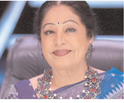
'विजय विश्व हुनर हमारा' - सोनी एंटरटेनमेंट

टेलीविजन का टैलेंट रियलिटी शो 'इंडियाज गॉट टैलेंट सीजन 10' अपने नए संस्करण में यही भावना पेश करने जा रहा है। एक बार फिर यह मंच ऐसे साधारण लोगों को चमकने का मौका देगा, जिनमें असाधारण प्रतिभा कहलाने की काबिलियत हो, जहां वे इस प्रतिष्ठित मंच पर अपने अનોखे हुनर का प्रदर्शन करेंगे। एक से बढ़कर एक रोमांचक और दिल छू लेने वाली परफॉर्मेंस के साथ यह सीजन भारत के सबसे बेहतरीन अनखोजे रत्नों और उनके असाधारण टैलेंट को सामने लाएगा, जिनमें डांसर्स, सिंगर्स, जादूगर और ऐसे बेहतरीन कलाकार शामिल होंगे।