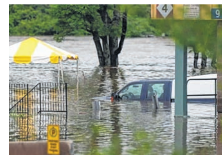
A vehicle stuck in the middle of a flooded street due to rainfall in Nova Scotia, Canada

Four people in Canada, including two children, were reported missing Saturday in flooding triggered by torrential rains in