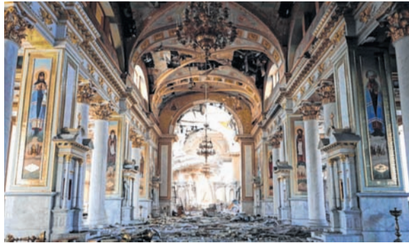
Transfiguration Cathedral destroyed following a missile strike

In his home, the ceiling partially collapsed, the balcony came off the side of the building, and all the windows were blown out. The Transfiguration Cathedral, one of the most important and largest Orthodox Cathedrals in Odesa, was severely damaged.