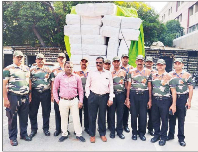
नगर निगम का प्रवर्तन दल पकड़ी गयी प्रतिबंधित प्लास्टिक के साथ।