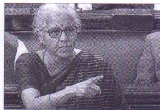
नई दिल्ली में शुक्रवार को आम बजट पर चर्चा के दौरान राज्यसभा में विधायी दर्जे के सचिव के तौर पर अपनी बात रखती निर्मला सीतारमण।

नई दिल्ली | एपीसी वित्त मंत्री निर्मला सीतारमण ने शुक्रवार को कहा कि क्रिप्टो करंसी के लेन-देन से होने पर लगाना पर कर लगाना सरकार का संप्रभु अधिकार है। उन्होंने कहा कि इस पर कर लगाने का मतलब यह नहीं है कि वह वैध हो जाएगा। इस पर पाबंदी के बारे में निर्णय विचार-विमर्श से मिलने वाली निष्पत्ति के आधार पर किया जाएगा।