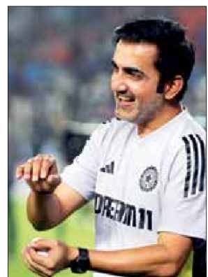
Gautam Gambhir said Shreyas Iyer was never meant to be benched.

Iyer was preferred over Jaiswal eventually and Gambhir