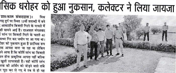
चित्तौड़गढ़ (प्रातःकाल संवाददाता)। विध धरोहर चित्तौड़गढ़ दुर्ग पर स्थित 13वीं शताब्दी में बने कीर्ति स्तंभ पर आकाशीय बिजली गिरने के मामले में गंभीर लापरवाही सामने आई है। दरअसल मंगलवार रात्रि को कीर्ति स्तंभ पर बिजली गिरने के चलते 40 किलो वजन की पत्थर गिर कर जमीन पर आ गया था। जिससे इस धरोहर को नुकसान हुआ है। प्रांतीयक रूप से इसे प्राकृतिक आपदा माना जा रहा था लेकिन पड़ताल में सामने आया है कि कीर्ति स्तंभ का बिजली गिरने से नुकसान होना प्राकृतिक आपदा नहीं बल्कि विमोचकों की खुरी लापरवाही है। वही कीर्ति स्तंभ लगे तड़ित चालक की अर्थिंग को जोड़ने वाले तारों को अज्ञात चोर चुग कर तो गए थे तब से ही यह तड़ित चालक नाबालग है और कबल को पोस बना हुआ है।