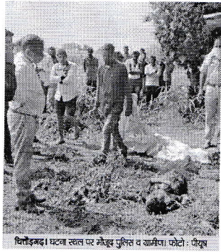
चित्तौड़गढ़। घटना स्थल पर मेडिकल पुलिस व सामीप्य।