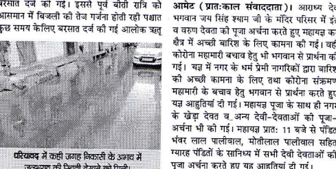
परिवार में कहीं जगह किराले के उमस में जलजला की टिपणी देखते की मिली।