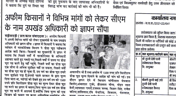
बड़ीसदर (प्रातःकाल संवाददाता)। अफीम किसानों ने अफीम विभिन्न मांगों को लेकर उपखंड अधिकारी को ज्ञापन सौंपा।

बड़ीसदर (प्रातःकाल संवाददाता)। अफीम किसानों ने अफीम विभिन्न मांगों को लेकर उपखंड अधिकारी को ज्ञापन सौंपा। ज्ञापन में किसानों ने बताया कि वर्षा में नारकोटिक्स विभाग ने खेड चुरा गैरकानूनी बर्तन बंद किया। किसानों का मुख्यग्रन्थी से ज्ञापन में बताया कि पिछले वर्षों में नारकोटिक्स के अधिकारी प्रशासन कर रहे हुए पकड़े गए, पिछले वर्षों में ससप पर डेरा चुरा कर कने हुए नहीं पहुंचे, पिछले वर्ष का डेरा चुरा एक सीमा से अधिक सुरक्षित नहीं कर सके, पिछले वर्षों का डेरा चुरा 72 हो चुका है, इस वर्ष का डेरा चुरा हमारे पास सुरक्षित पड़ा है, हमको पकड़े सके के द्वारा मुझे जताया था, महंगाई को देखते हुए इस वर्ष हम को 1500 रुपये प्रति किलोग्राम डेरा चुरा का मुद्दा देकर डेरा चुरा चुर कर कने ज्ञापन में बताया, विना मुद्दा इस वर्ष हम डेरा चुरा चुर कर कने हैं, हमको यह, हमको विना मुद्दा को एक किसान को फसल गह कना अर्थात्कि, अर्थात्कि और