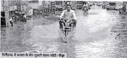
चित्तौड़गढ़ में बरसात के बीच गुजरते बहना

चित्तौड़गढ़ (प्रातःकाल संवाददाता)। जिला मुख्यालय पर गुरुवार को दोपहर में झमाझम बरसात शुरू हो गई, जिससे कुछ देर की लोगों को राहत व उमस से राहत मिली। सुबह से ही तेज गर्मी और धूप के शहिल या वही दोपहर बाद बालू जग और बरसात शुरू हो गई जिसके चलते महार सहित विभिन्न क्षेत्रों में झमाझम बारिश होने से सड़कों पर पानी भर गया और वही बारिश के होने से किसानों के चेहरे भी खिल उठे। फसलों को बीजबतल मिलने लगी। वहीं इससे गर्मी से परेशान हो रहे हैं, लोगों को भी कुछ देर के लिये राहत मिली।