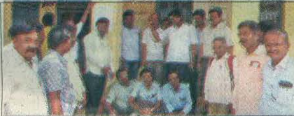
ಮಾಗಡಿ ಪಟ್ಟಣದ ತಾ.ಪಂ. ಎದುರು ಸಮಗ್ರ ಶಿಕ್ಷಣ ಅಭಿಯಾನದಡಿ ಕಾರ್ಯನಿರ್ವಹಿಸುವ ಶಿಕ್ಷಕರು ವೇತನಕ್ಕಾಗಿ ಧರಣಿ ನಡೆಸಿದರು.