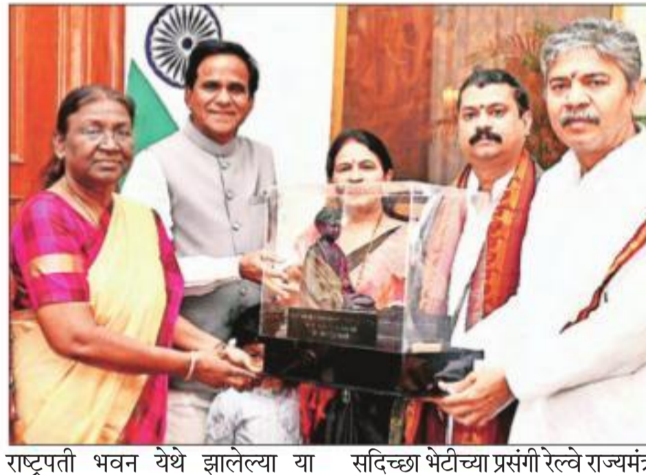
राष्ट्रपती भवन येथे झालेल्या या सदृच्छा भेटीच्या प्रसंगी रेल्वे राज्यमंत्री