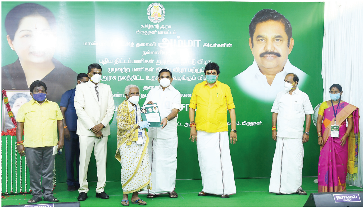
முதலமைச்சர் எடப்பாடி பழனிசாமி விருதுநகர் மாவட்ட கலெக்டர் அலுவலகத்தில் நடைபெற்ற நிகழ்ச்சியில் பயனாளிகளுக்கு அரசு நலத்திட்ட உதவிகளை வழங்கினார்.