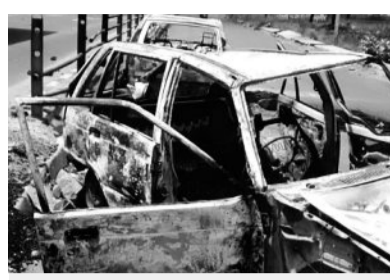
Mandasaur in 2017, a few days after the police firing