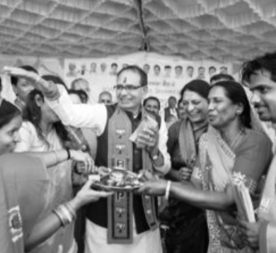
Madhya Pradesh Chief Minister Shivraj Singh Chouhan (centre) with supporters during a public meeting ahead of the state elections in Rajgarh district

By Wednesday evening, the last day of campaigning for the Madhya Pradesh Assembly polls, Prime Minister (PM) Narendra Modi would have addressed a dozen and a half election rallies and road shows. Chief Minister Shivraj Singh Chouhan, who has been on the road for the past month, has addressed eight to ten public meetings on a daily basis. However, at the start of the Bharatiya Janata Party (BJP)'s election campaign, this two-pronged campaign strategy featuring Modi and Chouhan wasn't evident. The BJP opened its campaign in the state with the theme song "MP keman mein Modi " (MP is close to Modi's heart). The central leadership fielded seven of the party's Lok Sabha members, including three Union ministers and a party general secretary, perhaps, in a tacit admission that Chouhan wasn't the face of the campaign. Until 2018, the chief minister led the pre-election "Jan Ashirwad Yatra" campaign. This time, the party organised five campaigns with five different leaders.