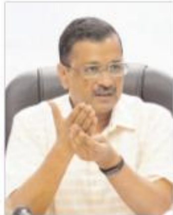
केजरीवाल ने कहा कि दिल्ली में गंदे पानी की समस्या पूरी तरह से खत्म करनी है। इसके लिए दिल्ली जल बोर्ड को एक योजना बनाकर देने का निर्देश दिया गया है।

दिल्ली के लोग जल्द ही टॉटी से साफ पानी पी सकेंगे यह बातें मुख्यमंत्री अरविंद केजरीवाल ने बुधवार को दिल्ली जल बोर्ड की समीक्षा बैठक के बाद कही। उन्होंने गंदे पानी की आपूर्ति की समस्या का स्थाई निदान करने के सख्त निर्देश दिए। केजरीवाल ने कहा कि दिल्ली में गंदे पानी की समस्या पूरी तरह से खत्म करनी है। इसके लिए दिल्ली जल बोर्ड (डीजेबी) को एक योजना बनाकर देने का निर्देश दिया गया है।