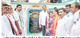
జైవీ పన్ను క్రీడలను ప్రోత్సహించే ప్రణాళికను ప్రభుత్వం వ్యవహారాల శాఖలో ప్రతిపాదించి ప్రజాసభలో ప్రతిపాదించి...