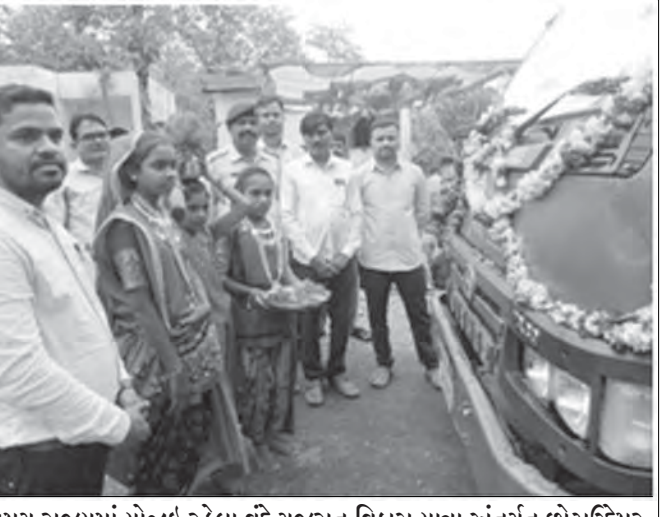
સમગ્ર રાજ્યમાં યોજાઈ રહેલા વડે ગુજરાત વિકાસ યાત્રા અંતર્ગત ઇટાઉદ્દિપુર જિલ્લામાં પણ જિલ્લા પંચાયત બેઠક દીઠ કાર્યક્રમોનું આયોજન કરવામાં આવી રહ્યું છે. જે અંતર્ગત ઇટાઉદ્દિપુર જિલ્લાના જેતપુર પાલી તાલુકામાં આવેલી રવું-સાબવા જિલ્લા પંચાયત બેઠકમાં સમાવિષ્ટ બોરધા ગામે વડે ગુજરાત વિકાસ રથ આવી પહોંચતા ગામના સરપંચ, જેતપુર પાલી તાલુકાના સર્કલ ઓફિસર, રેન્જ ફોરેસ્ટ ઓફિસર, મેડિકલ સ્ટાફ, તલાટી તેમજ ગામના અગ્રણીઓ તેમજ ગ્રામજનોએ રથનું સાર્થક કરી સ્વાગત કર્યું હતું. જે તસ્વીરમાં દ્રશ્યમાન થાય છે.

લઈ જઈ શકશે. અગાઉ મંજૂરી મળ્યા બાદ અરજીમાં દર્શાવેલ સમયગાળા કે મંજૂરી મળ્યાના બ મહિનામાં યાત્રા કરવાની હતી અન્યથા મંજૂરી આપોઆપ રદ ગણાતી હતી, ત્યારે હવે કરાયેલા ફેરફાર અનુસાર હવે યાત્રાની તારીખના એક અઠવાડિયા પૂર્વે અરજી કરવાની રહેશે અને મંજૂરી મળ્યા બાદ અરજીમાં દર્શાવેલ સમયગાળા દરમિયાન અથવા મંજૂરી મળ્યા બાદ બે માસમાં યાત્રા કરવાની રહેશે અન્યથા મંજૂરી આપોઆપ રદ થયેલી ગણાશે. હવે ગુજરાત વાહન વ્યવહાર નિગમની ૧૬ વિભાગીય કચેરીઓમાં બોર્ડ ના એક-એક પ્રોજેક્ટ આસિસ્ટન્ટની નિમણૂક કરવામાં આવશે, જે એસ.ટી./ખાનગી બસ મારફતે પ્રવાસની અરજીઓ સ્વીકારશે તેને મંજૂરી માટે બોર્ડ ખાતે મોકલાવશે.