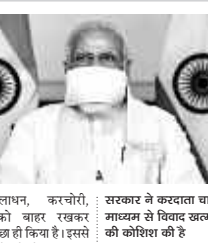
होगा। कालाभ, करचोरी, घोषाखोड़ी को बाहर रखकर सरकार ने अच्छे किया है। इससे इन गतिविधियों को प्रोत्साहन नहीं मिलेगा और अंकुश लगाने में भी मदद मिलेगी। आज जबरन इस बात की है कि नई प्रणाली को ईमानदारी से देखाभर में लागू किया जाए

केंद्र सरकार ने करधान को नई व्यवस्था लागू की है जिस पर बहस जारी है। देश का यह दुर्भाग्य ही रहा है कि अब तक कोई व्यवस्थित कर प्रणाली लागू नहीं की गई जिससे विवाद और कानूनी जटिलताओं से निजात मिल सके। सरकार ने करदाता चार्टर के माध्यम से विवाद खत्म करने की कोशिश की है जो समय को देखते हुए प्रासंगिक है। इस चार्टर से व्यापारियों को सुविधा मिलेगी। समय पर करों के भुगतान से अदालती विवाद भी धर्मगत प्रकरण को तरह लगा है जिसके दुर्घटनाएँ लंबे समय तक देखने को मिलेंगी। एवं कर प्रणालियों से भले ही लोगों को परेशानित पायदा हो मिला हो पर समाज के बढ़ प्रयास अवश्य सकार