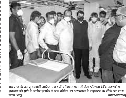
महाराष्ट्र के उप मुख्यमंत्री अजित पवार और विधानसभा में नेता प्रतिपक्ष देवेंद्र फडणवीस शुक्रवार को पुणे के बाणेर इलाके में एक कोविड-19 अस्पताल के उद्घाटन के मौके पर साथ में एक पत्रे के