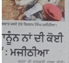
ਫ ਦੇ ਜਵਾਨਾਂ ਨੇ ਫ ਦੇ ਜਵਾਨਾਂ ਨੂੰ ਮਦਦ ਦਿੱਤੀ।

ਪੰਜ ਪ੍ਰਕਾਰ, ਕਾਰਕੁਨਾਂ 'ਚੋਂ ਫ ਦੇ ਜਵਾਨਾਂ ਨੂੰ ਮਦਦ ਦਿੱਤੀ।