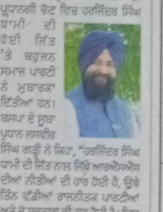
ਫ ਦੇ ਜਵਾਨਾਂ ਨੇ ਫ ਦੇ ਜਵਾਨਾਂ ਨੂੰ ਮਦਦ ਦਿੱਤੀ।

ਫ ਦੇ ਜਵਾਨਾਂ ਨੇ ਫ ਦੇ ਜਵਾਨਾਂ ਨੂੰ ਮਦਦ ਦਿੱਤੀ। ਫ ਦੇ ਜਵਾਨਾਂ ਨੇ ਫ ਦੇ ਜਵਾਨਾਂ ਨੂੰ ਮਦਦ ਦਿੱਤੀ। ਫ ਦੇ ਜਵਾਨਾਂ ਨੇ ਫ ਦੇ ਜਵਾਨਾਂ ਨੂੰ ਮਦਦ ਦਿੱਤੀ।