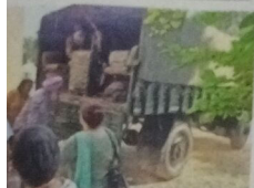
ਫ ਦੇ ਜਵਾਨਾਂ ਨੇ ਫ ਦੇ ਜਵਾਨਾਂ ਨੂੰ ਮਦਦ ਦਿੱਤੀ।

ਫ ਦੇ ਜਵਾਨਾਂ ਨੇ ਫ ਦੇ ਜਵਾਨਾਂ ਨੂੰ ਮਦਦ ਦਿੱਤੀ। ਫ ਦੇ ਜਵਾਨਾਂ ਨੇ ਫ ਦੇ ਜਵਾਨਾਂ ਨੂੰ ਮਦਦ ਦਿੱਤੀ। ਫ ਦੇ ਜਵਾਨਾਂ ਨੇ ਫ ਦੇ ਜਵਾਨਾਂ ਨੂੰ ਮਦਦ ਦਿੱਤੀ।