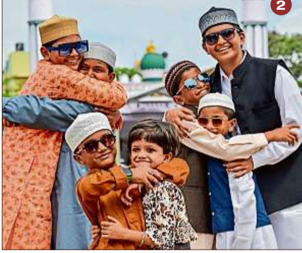
2. ಚಾಮರಾಜಪೇಟೆಯ ಈದ್ಗಾ ಮೈದಾನದಲ್ಲಿ ಬಕ್ರೀದ್ ಹಬ್ಬವನ್ನು ಮಕ್ಕಳು ಸಂಭ್ರಮಿಸಿದ್ದು ಹೀಗೆ..

ಚಾಮರಾಜಪೇಟೆಯಲ್ಲಿ ಬಕ್ರೀದ್ ಆಂಗವಾಗಿ ನಡೆದ ಸಾಮೂಹಿಕ ಪ್ರಾರ್ಥನೆ ನಂತರ ಅವರು ಮಾತನಾಡಿದರು. ‘ಎಲ್ಲರೂ ಭಕ್ತಿಯಿಂದ ಪ್ರಾರ್ಥನೆ ಯಲ್ಲಿ ಭಾಗವಹಿಸಿ ಮನುಕುಲಕ್ಕೆ ಒಲಿತಾ ಗಲಿ ಎಂದು ಪ್ರಾರ್ಥಿಸಿದ್ದಾರೆ. ಎಲ್ಲರೂ ಸಾಮೂಹಿಕ ಪ್ರಾರ್ಥನೆ ಮಾಡಿದ್ದು, ಸವಾಬದಲ್ಲಿ ನಾವೆಲ್ಲರೂ ಅಣ್ಣ ತಮ್ಮಂದಿರ ಹಾಗೆ ಪರಸ್ಪರ ಪ್ರೀತಿ ವಿಶ್ವಾಸದಿಂದ ಬಾಳಬೇಕು’ ಎಂದು.