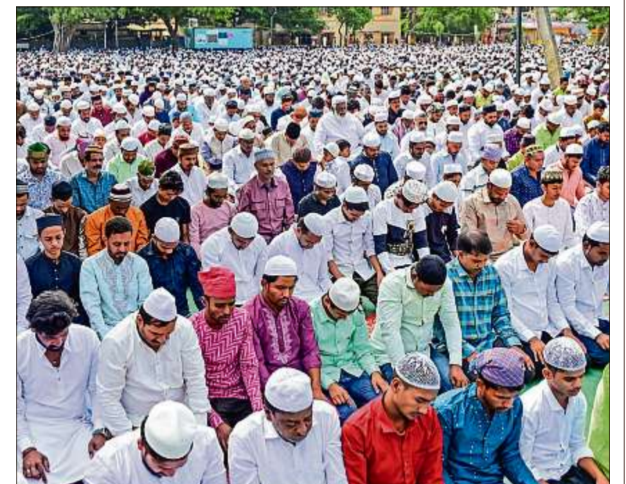
ಚಾಮರಾಜಪೇಟೆಯ ಈದ್ಗಾ ಮೈದಾನದಲ್ಲಿ ಈದ್ ಉಲ್ ಅದಾ ಹಬ್ಬದ ಆಂಗವಾಗಿ ಮುಸ್ಲಿಂ ಸಮುದಾಯದವರು ಸಾಮೂಹಿಕ ಪ್ರಾರ್ಥನೆ ಸಲ್ಲಿಸಿದರು

ತಾಗ್ ಹಾಗೂ ಬಲಿದಾನದ ಸಂಕೇತವಾದ ಬಕ್ರೀದ್ ಅನ್ನು ಮುಸ್ಲಿಂ ಸಮುದಾಯದವರು ನಗರದಲ್ಲಿ ಶ್ರದ್ಧೆ ಹಾಗೂ ಭಕ್ತಿಯಿಂದ ಆಚರಿಸಿದರು. ಮುಸ್ಲಿಮರಲ್ಲಿ ಸಾಮೂಹಿಕ ಪ್ರಾರ್ಥನೆ ನಡೆಯಿತು. ಸಮುದಾಯದವರು ಪ್ರಾರ್ಥನೆಯಲ್ಲಿ ಪಾಲ್ಗೊಂಡರು. ಚಾಮರಾಜಪೇಟೆ, ಚಾದರಾಯನಪುರ, ಕಲಾಪಾಳೆ, ಮೈಸೂರು ರಸ್ತೆ, ಶಿವಾಜಿನಗರ, ಹಬ್ಬಾಳ, ಆರ್.ಟಿ.ನಗರ, ಶಾಂತಿನಗರ, ಲಾಲ್‌ಬಾಗ್ ರಸ್ತೆ, ಮಾಗಡಿ ರಸ್ತೆ, ಕಮ್ ಗೊಂಡನಹಳ್ಳಿ ಸೇರಿದಂತೆ ನಗರದ ವಿವಿಧೆಡೆ ಯಿರುವ ಪ್ರಮುಖ ಮಸೀದಿಗಳಲ್ಲಿ ಮುಸ್ಲಿಂ ಬಾಂಧವರು ಪ್ರಾರ್ಥನೆ ಸಲ್ಲಿಸಿದರು. ಮಕ್ಕಳು, ದೊಡ್ಡವರು ಹೊಸ ಬಟ್ಟೆ ಧರಿಸಿ, ಹೊಸ ಟೋಪಿ ತೊಟ್ಟು ಸಂಭ್ರಮಿಸಿದರು. ಪರಸ್ಪರ ಅಲಂಕಾರ ಕೊಂಡು ಶುಭಾಶಯ ವಿನಿಯಮ ಮಾಡಿಕೊಂಡರು. ಮಕ್ಕಳು ಶುಭಾಶಯ ವಿನಿಯಮ ಮಾಡಿಕೊಂಡರು.