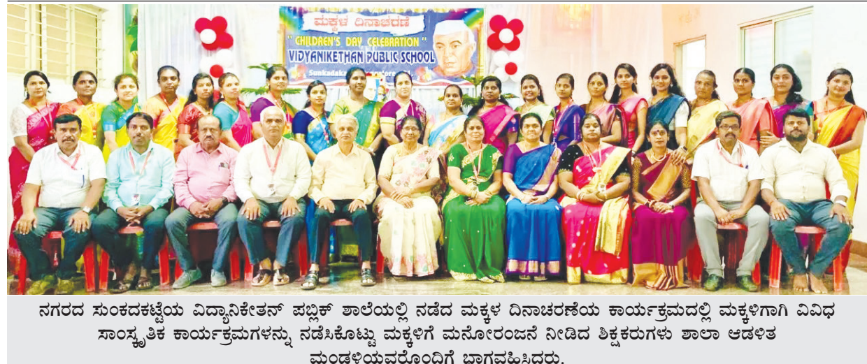
ನಗರದ ಸುಂದರವಾದ ವಿದ್ಯಾನಿಕೇತನ್ ಪಬ್ಲಿಕ್ ಶಾಲೆಯಲ್ಲಿ ನಡೆದ ಮಕ್ಕಳ ದಿನಾಚರಣೆಯ ಕಾರ್ಯಕ್ರಮದಲ್ಲಿ ಮಕ್ಕಳಿಗಾಗಿ ವಿವಿಧ ಸಾಂಸ್ಕೃತಿಕ ಕಾರ್ಯಕ್ರಮಗಳನ್ನು ನಡೆಸಿಕೊಟ್ಟು ಮಕ್ಕಳಿಗೆ ಮನೋರಂಜನೆ ನೀಡಿದ ಶಿಕ್ಷಕರುಗಳು ಶಾಲಾ ಆಡಳಿತ ಮಂಡಳಿಯವರೊಂದಿಗೆ ಭಾಗವಹಿಸಿದರು.