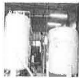
পদ্মা জেলার সিদ্ধি হাসপাতালে যেখানে টি আইসি বৈদ্যুতিক সিস্টেম করা হয়েছে।

নিম্নে প্রতিবেদন: বারাসত জেলা সদর হাসপাতালে অক্সিজেন প্ল্যান্টের উদ্বোধন করা হয়েছে।