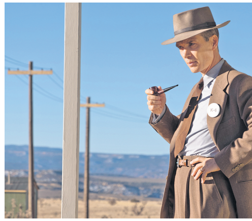
Cillian Murphy in Oppenheimer.

Respond to this column at feedback@livemint.com