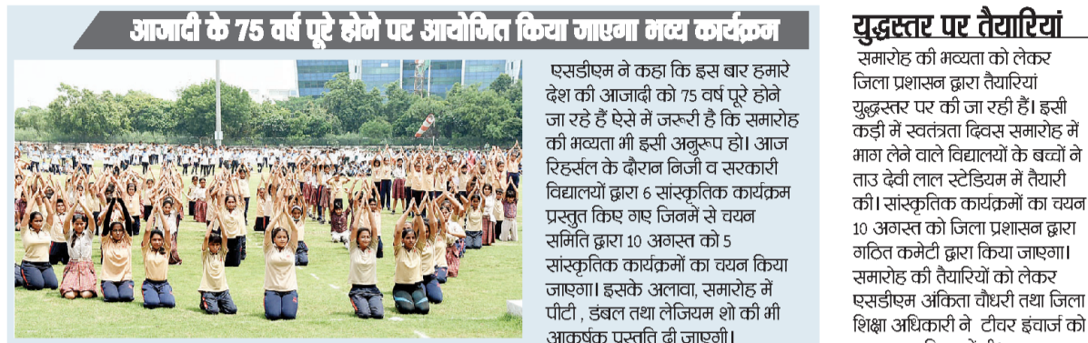
आजादी के 75 वर्ष पूरे होने पर आयोजित किया जाएगा मय कार्यक्रम

15 अगस्त की तैयारियां युद्धस्तर पर की जा रही हैं। इसी कड़ी में भाग लेने वाले बच्चों ने ताउ देवी लाल स्टेडियम में तैयारी की। सांस्कृतिक कार्यक्रमों का चयन 10 अगस्त को जिला प्रशासन द्वारा गठित कमेटी के प्रतिनिधियों द्वारा किया जाएगा।