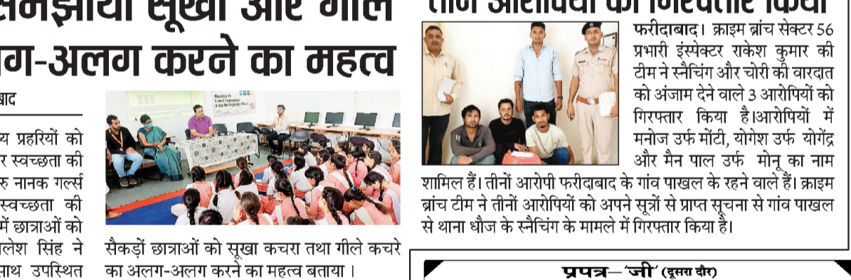
सैकड़ों छात्राओं को सूखा कचरा तथा गीले कचरे का अलग-अलग करने का महत्व बताया।