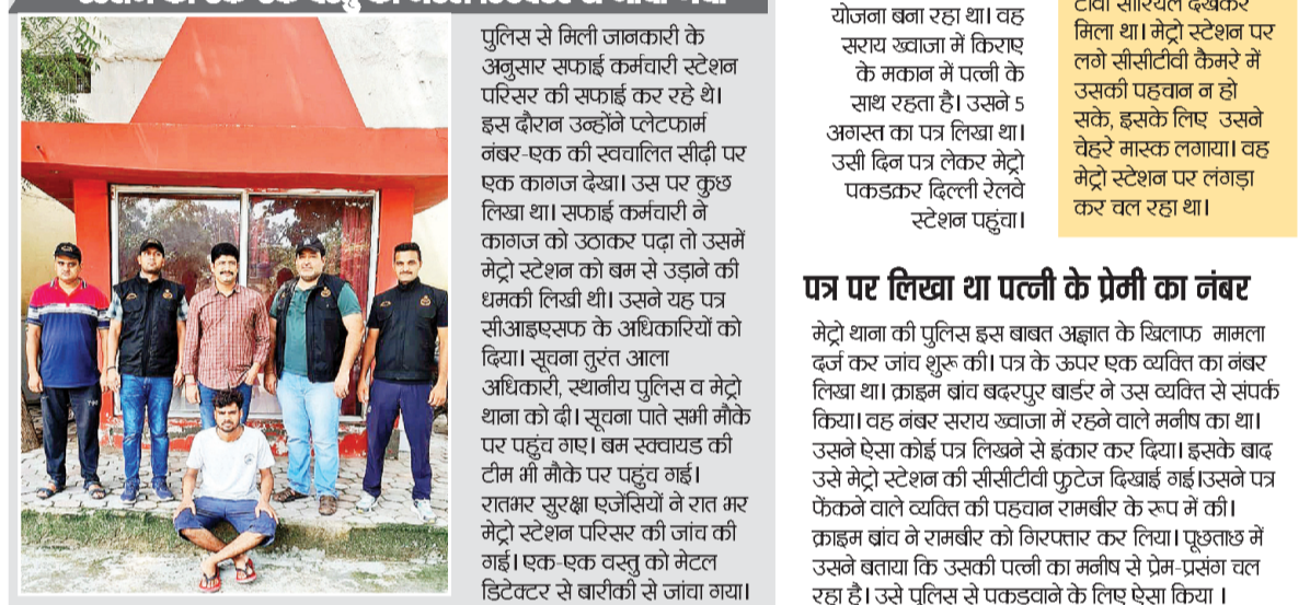
पुलिस ने मिली जानकारी के अनुसार सफाई कर्मचारी स्टेशन परिसर की सफाई कर रहे थे। इस दौरान उन्होंने प्लेटफार्म नंबर-एक की स्वचालित सीढ़ी पर एक कागज देखा। उस पर कुछ लिखा था। सफाई कर्मचारी ने कागज को उठाकर पढ़ा तो उसमें मेट्रो स्टेशन को बम से उड़ाने की धमकी लिखी थी। उसने यह पत्र सीआइएसफ के अधिकारियों को दिया। सूचना तुरंत आला अधिकारी, स्थानीय पुलिस व मेट्रो थाना को दी। सूचना पाते सभी मौके पर पहुंच गए। बम स्क्वाड की टीम भी मौके पर पहुंच गई। रातभर सुरक्षा एजेंसियों ने रात भर मेट्रो स्टेशन परिसर की जांच की गई। एक-एक वस्तु को मेटल डिटेक्टर से बारीकी से जांचा गया।