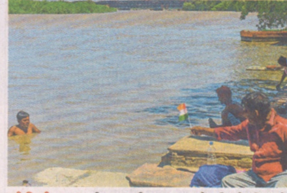
नवी दिल्ली: यमुना नदीच्या पातळीत वाढ झाल्याने शनिवारी परिसरातील नागरिकांना नदीत स्नान करण्याचा मोह आवरता आला नाही.