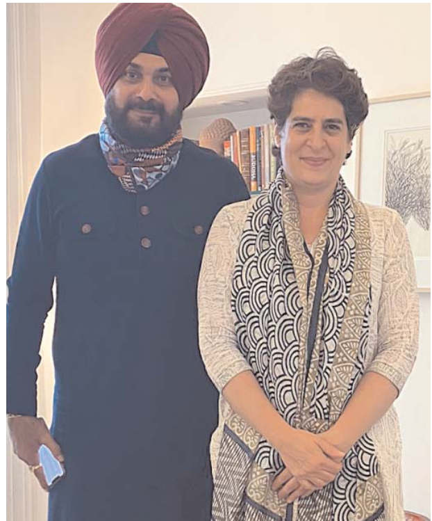
पंजाब कांग्रेस नेता नवजोत सिंह सिद्धू कांग्रेस महासचिव प्रियंका गांधी वाड़ा से मुलाकात करते हुए।