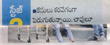
నేనులు శరవేగంగా పెరుగుతున్నాయి. చావులు