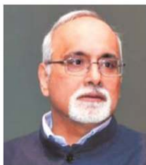
M Rajeshwar Rao

The boards of banks should hold the management accountable for its actions, and should replace it if it does not meet expectations, M Rajeshwar Rao, deputy governor of the Reserve Bank of India (RBI), said in an interaction with board members of banks. "Boards should appraise the performance of management objectively and ensure that they are held accountable for their actions. If the management is not meeting expectations, boards should take suitable action, including replacing the management, to improve the bank's governance and risk management," Rao said in his speech at the conference of the directors of banks. The RBI had organised the conference for public sector banks on May 22 in New Delhi and private sector banks on May 29 in Mumbai.