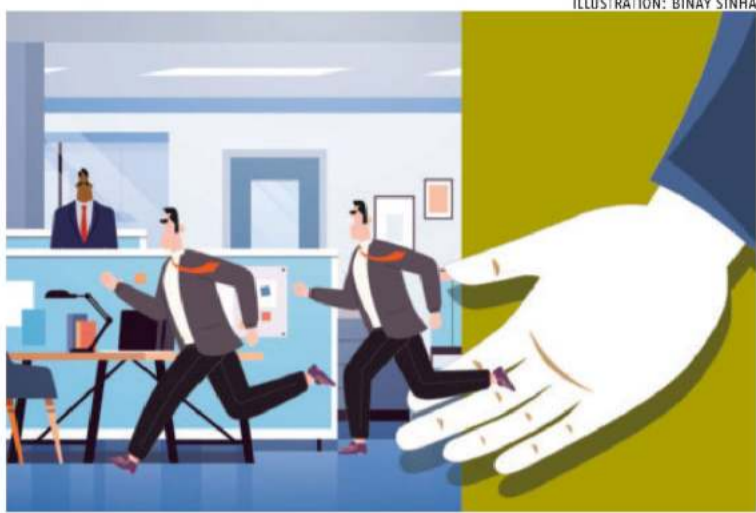
ILLUSTRATION: BINAY SINHA

Now that the initial brouhaha of 2019 is over, the DoPT is ambivalent about publicising the initiative. The department's website lists lateral recruitment in its booklet from last year, "Reinventing Governance — Major Reforms and Initiatives from 2014-2022". But given that government employment is a hot button issue in a poll-heavy year, last week, when the department issued two booklets on "9 Years of Administrative Reforms (2014-2023)" that lists the government's achievements in making the civil services at various levels respond to citizens' demands, there is no mention of lateral recruitments anywhere. Both booklets were released by Jitendra