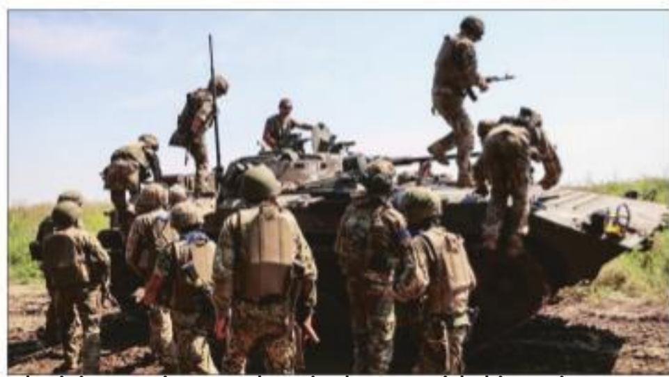
Ukrainian service members in the Zaporizhzhia region

MORE THAN A month after it attended a meeting on Ukraine in Copenhagen, India will join another in Saudi Arabia on August 5 and 6 that is going to discuss the Russia-Ukraine conflict and ways to end the 17-month war.