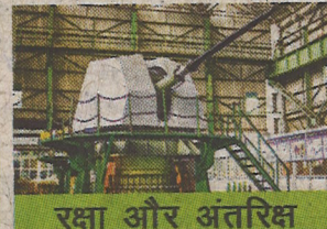
रक्षा और अंतरिक्ष