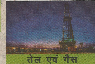
तेल एवं गैस