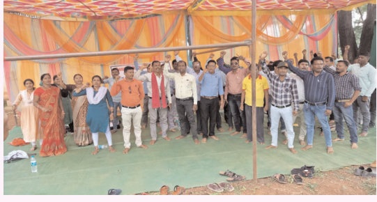
श्रमबिन्दु / बकावंड

छत्तीसगढ़ सहायक शिक्षक समग्र शिक्षक फेडरेशन के आह्वान पर प्रथम नियुक्ति तिथि से सेवा गणना कर वेतन विसंगति दूर करने की मांग को लकर सहायक शिक्षकों की अनिश्चितकालीन हड़ताल जारी है। प्रायमरी स्कूलों में पहले से ही शिक्षकों की कमी बनी हुई है, ऊपर से सहायक शिक्षक हड़ताल पर चले गए हैं। इसके चलते पठन पाठन व्यवस्था बिगड़ने लगी है। बस्तर जिले की बकावंड तहसील कार्यालय के सामने छत्तीसगढ़ सहायक शिक्षक समग्र शिक्षक फेडरेशन के नेतृत्व में अनिश्चितकालीन धरना प्रदर्शन जारी है।