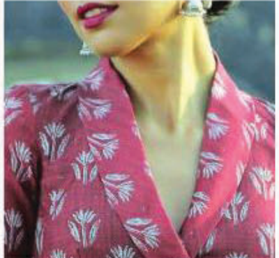
शीयर, जो बहुत ही यूनिक और स्टायलिश लगता है। नेक पर आप चाहे तो रफल भी ट्राई कर

साड़ी का फैशन कभी आउट नहीं होता बस समय-समय पर इनमें नए-नए डिजाइन और पैटर्न देखने को मिलते रहते हैं। तो अगर आपके पास ऐसी कोई साड़ी है तो उसे टीमअप कर सकती हैं खूबसूरत ब्लाउज के साथ। मौसम को देखते हुए बेहतर होगा लाइट कलर और फेब्रिक वाली साड़ियाँ चुनें जिसमें आप पूरी तरह से कम्फर्टेबल रहेंगी। लेकिन शायद वे ऑफिश शायदी-पार्टी के हिसाब से आपके लुक को कम्प्लीट न करें, तो इसके लिए आप उसे टीमअप करें हाई नेक ब्लाउज के साथ। अलग-अलग डिजाइन वाले हाई नेक ब्लाउज ज्यादातर परसिलिटी पर जंचते हैं। ■ शीयर पैटर्न: शीयर का पैटर्न ब्लाउज में हो या ड्रेस में ये बहुत ही खूबसूरत लुक देता है। तो इस बार हाई नेक ब्लाउज के साथ ट्राय करें