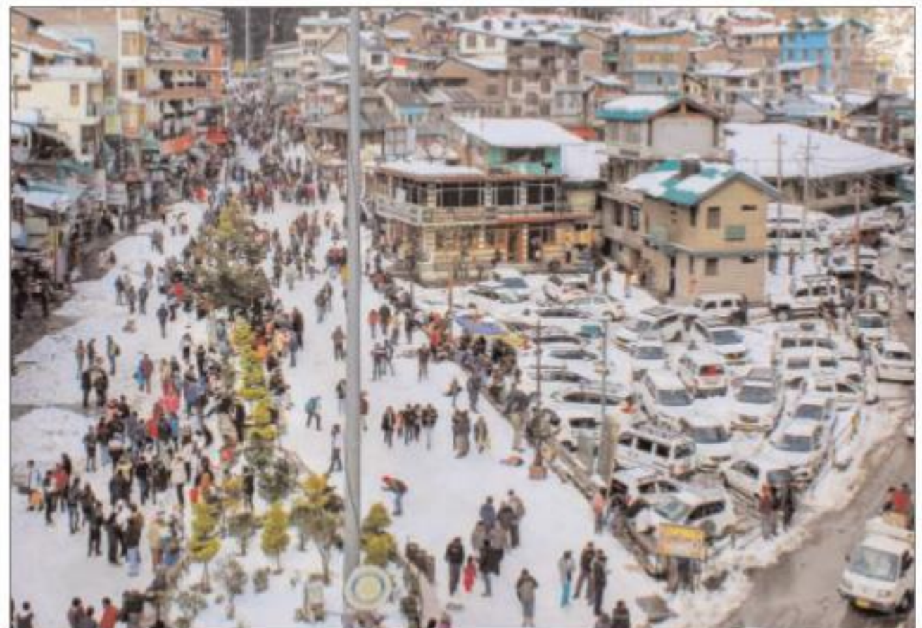
मनाली में माल रोड पर बर्फबारी का आनंद लेते सैलानी

कुल मिलाकर, लाहौल एवं स्पीति में 153 सड़कें, शिमला में 134, कुल्लू में 68, चंबा में 61, मंडी में 46, सिरमौर में आठ, किन्नौर में दो और कांगड़ा में एक सड़क बंद हो गई है। मौसम कार्यालय द्वारा साझा किए गए आंकड़ों के अनुसार, पिछले 24 घंटों में खदराला में चार सेंटीमीटर (सेमी), भरमौर में तीन सेमी, कुफरी में दो सेमी, गोंडला में 1.3 सेमी और सांगला में 0.5 सेमी बर्फबारी हुई जबकि कल्पा, कुकुमसेरी, नारकंडा और केलोंग में मामूली बर्फबारी देखने को मिली। कुल्लू व जिला लाहौल व स्पीति में एक सप्ताह से जारी बर्फबारी