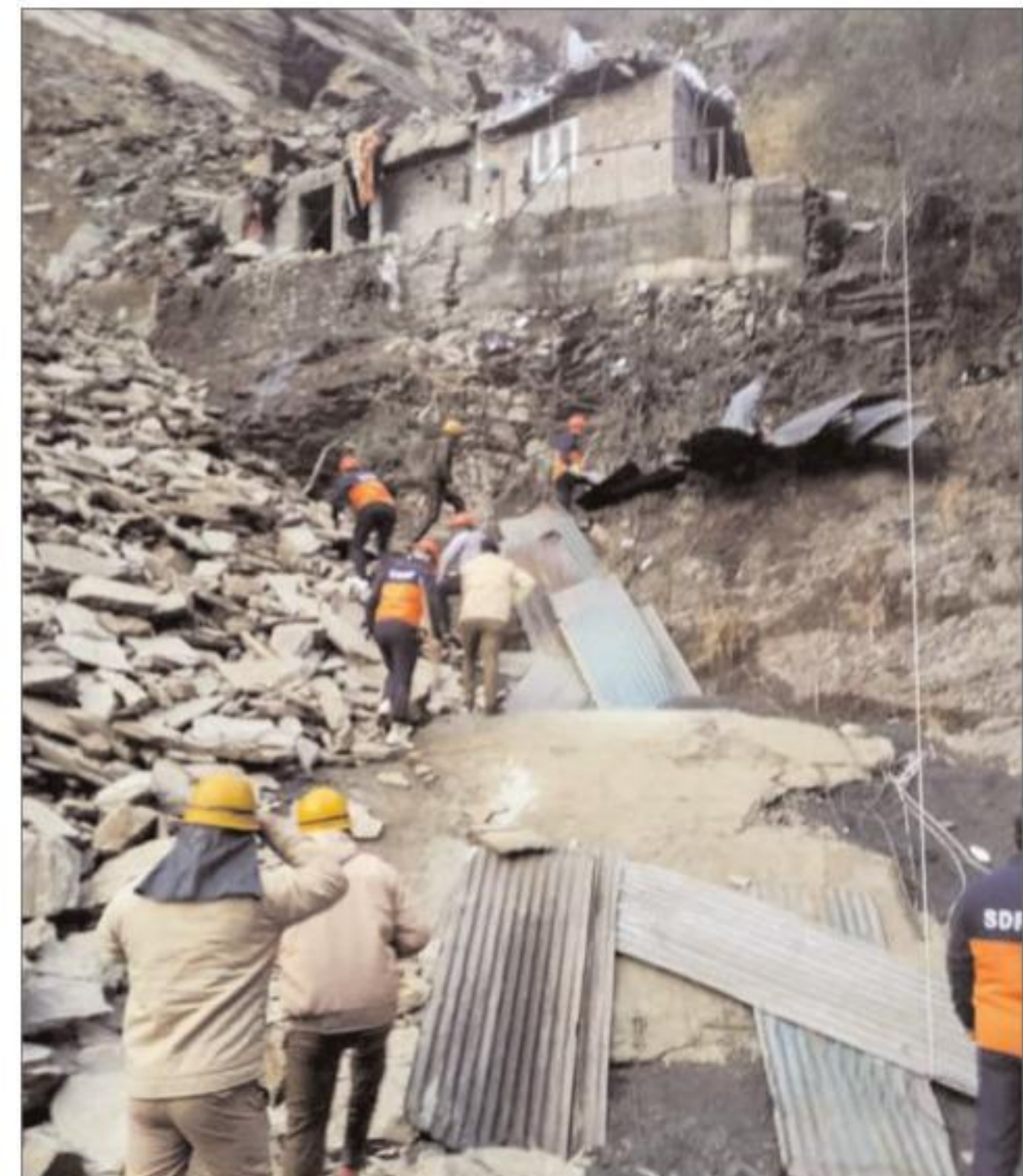
भूस्खलन के बाद बचाव कार्य करता दल।