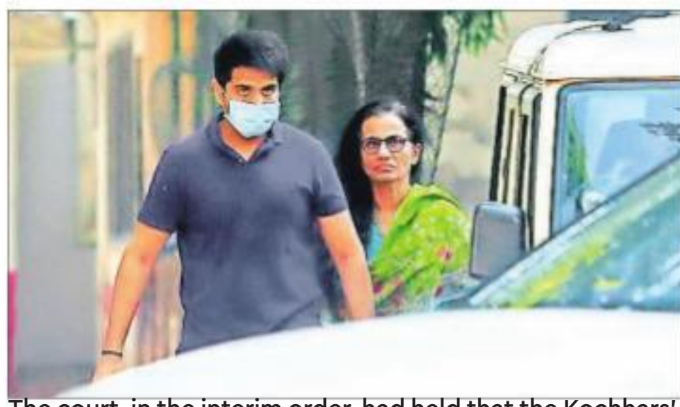
The court, in the interim order, had held that the Kochhars' arrests were not in accordance with law

order, had held that the Kochhars' arrests were not in accordance with law and in non-compliance with the mandate of sections 41(1)(b)(ii) (grounds of arrest), section 41A (notice of appearance issued by investigating officer) and section 60A (arrests to be made strictly in accordance with the code) of the Criminal Procedure Code (CrPC), "warranting their release on bail".