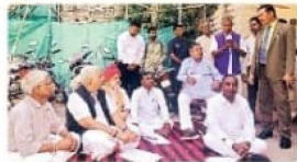
धरने पर बैठे विधायकों से सवा सौ करोड़ का पैसा