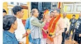
संभाग के जनप्रतिनिधियों के प्रति आदिवासियों की अगाध श्रद्धा है, वे स्वयं बंधें जुटेंगे, लेकिन कार्यकर्ताओं का काम है कि वे...

संभाग के हर जिले को दिया लोगों को लाने का लक्ष्य, 50 हजार लोग जुटेंगे