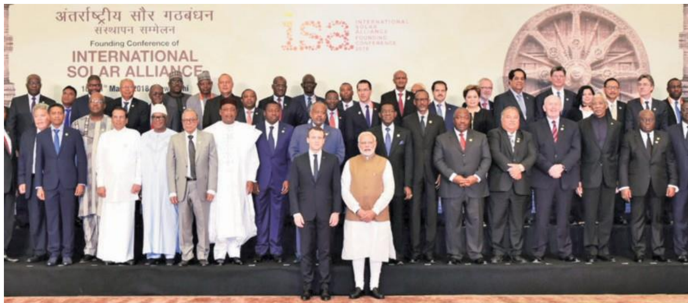
Prime Minister Narendra Modi with French President Emmanuel Macron at the founding conference of the International Solar Alliance in New Delhi on March 11, 2018

The CDRI was first proposed by Prime Minister Modi in 2016 at the Asian Ministerial Conference on Disaster Risk Reduction, reported to have stemmed from his experience of handling the 2001 earthquake in Gujarat when he was the chief minister. Bringing together national governments, UN agencies, multilateral development