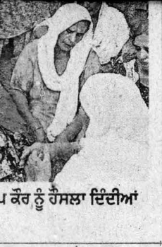
ਪ ਕੌਰ ਨੂੰ ਹੋਸਲਾ ਦਿੰਦੀਆਂ

ਪਾਲਤ ਨਾਇਬ ਤਹਿਸੀਲਦਾਰ- ਪਾਇਕ ਕੁਲੈਕਟਰ ਦਰਜਾ ਦੂਜਾ ਵਾਲ ਤਹਿ. ਵਾ ਜ਼ਿਲ੍ਹਾ ਮੋਗਾ।