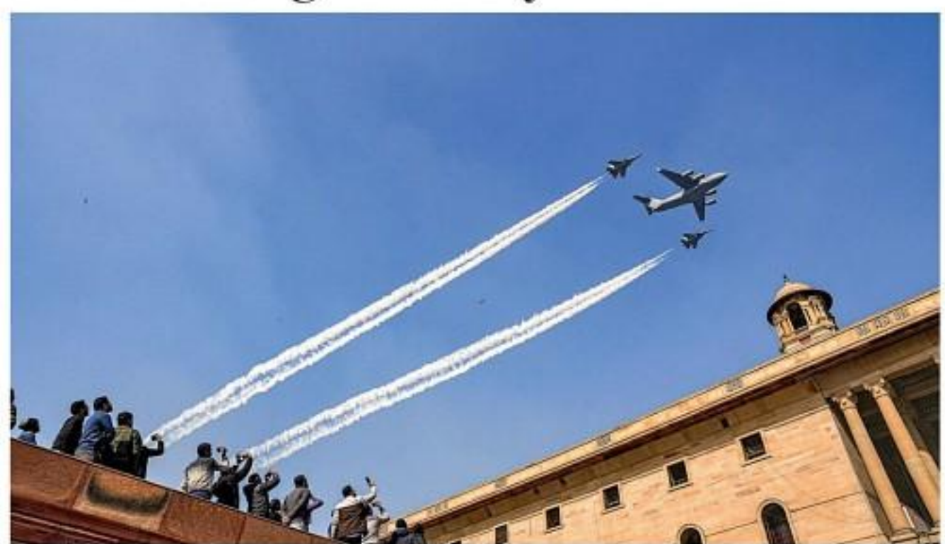
SOARING HIGH Aircraft of the Indian Air Force fly-past during the rehearsals for the Republic Day Parade 2023, at Kartavya Path in New Delhi, on Friday