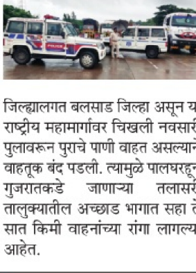
जिल्हालगत बलसाड जिल्हा असून या राष्ट्रीय महामार्गावर चिखली नवसारी पुलावरून पुराचे पाणी वाहत असल्याने वाहतूक बंद पडली. त्यामुळे पालघरहून गुजरातकडे जाणाऱ्या तलासरी तालुक्यातील अडथळ भागात सहा ते सात किमी वाहनांच्या रांगा लागल्या आहेत.

मुंबई-अहमदाबाद राष्ट्रीय महामार्ग क्रमांक ८वर गुजरातच्या नवसारी येथे पुराचे पाणी वाहत असल्याने वाहतूकीचा खोळंबा झाला. त्यामुळे महाराष्ट्र-गुजरात राज्यांच्या सीमा भागात अडथळ येणे सहा ते सात किमी लांब वाहनांच्या रांगा लागल्या. सुरक्षेच्या कारणास्तव पोलिस बंदोबस्त ठेवण्यात आला. राष्ट्रीय महामार्ग क्रमांक ८ पालघर जिल्ह्यातून गुजरातकडे जातो. गुजरात राज्यात मुसळधार पाऊस सुरू असून अनेक भागांत पूर आला आहे. पालघर