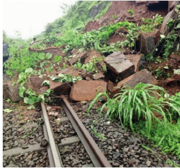
कोकण रेल्वे मार्गावर दगड-माती आल्याने वाहतूक खोळंबली.