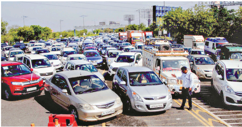
Traffic congestion at the DND Flyway on Monday