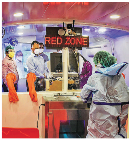
Medical workers in protective gear at a mobile coronavirus testing facility, in New Delhi on Monday

The senior member also said the implementation of the lockdown, meant to contain the spread, was treated more as a law and order issue than a public health one. "The whole exercise was overshadowed by enforcement rather than