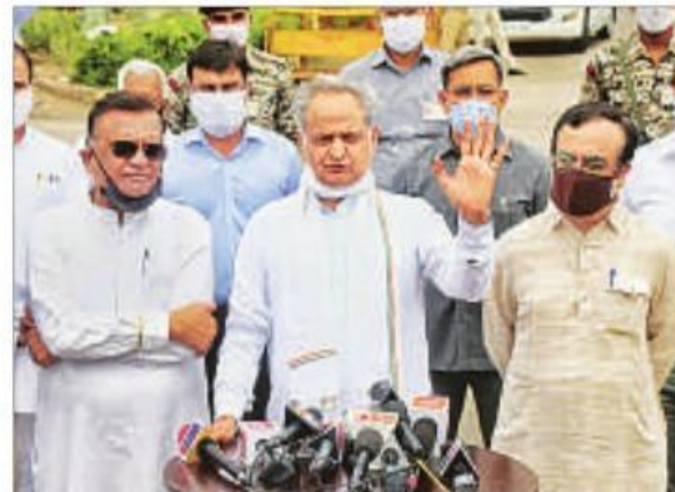
Rajasthan chief minister Ashok Gehlot with senior Congress leaders speaks to media in Jaipur on Friday

"It has never happened in the history of the country that the governor has not given the approval to call an assembly session. The governor is bound by the decisions of the cabinet,"