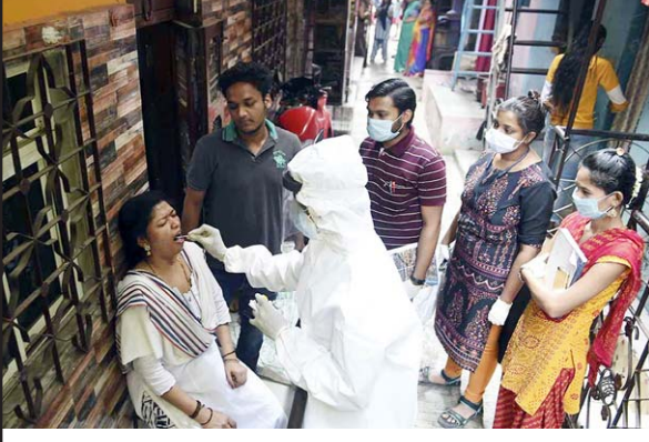
મહારાષ્ટ્રમાં કોરોનાના વધી રહેલા કેસને લઈને નાગપુરમાં ૧૫ થી ૨૧ માર્ચ સુધી લોકડાઉન લાગુ કરવાની જાહેરાત કરાઈ છે. રાજ્યમાં છેલ્લા ૨૪ કલાકમાં ૧૩,૬૫૯ કેસ નોંધાયા છે. મુંબઈમાં પણ નવા કેસોમાં ઉછાળો આવતા. કોરોના પ્રભાવિત એશિયાના સૌથી મોટા સ્વમ વિસ્તાર ધારાવીમાં પીપીઈ કિટ ઘટ્ટરીને હેલ્થ વર્કસ ડોર ટુ ડોર સ્ક્રીનિંગ કરી સ્થાનિક રહિશોના ધ્યાનમાં સેમ્પલ ટેસ્ટ કરવા માટે લઈ રહેલા નજરે પડે છે.

કે, જો પેટ્રોલ અને ડિઝલને જીએસટીના દાયરામાં લાવવામાં આવશે, તો કિંમતોમાં ૨૫ રૂપિયા ઘટાડો થશે. આ અંગે સત્યેન્દ્ર જૈન કહ્યું કે તમે એક પ્રતિનિધિ મંડળ લઈને કેન્દ્ર સરકારને મળો, અમારા બધા ધારાસભ્યો તમારી સાથે ચાલશે. આ પગલાથી દિલ્હીની સાથે સાથે આખા દેશને ફાયદો થશે. આ પહેલા ચર્ચા દરમિયાન બિધૂડીએ આરોપ લગાવ્યો હતો કે આમ આદમી પાર્ટીની સરકારના ઉંચા વેટને