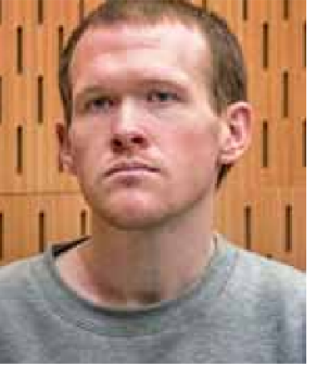
New Zealand's Court of Appeal confirmed on Tuesday that gunman Brenton Tarrant had filed the appeal last week.

The man who slaughtered 51 Muslim worshippers during the deadliest mass-shooting in New Zealand's history is appealing his conviction and sentence.