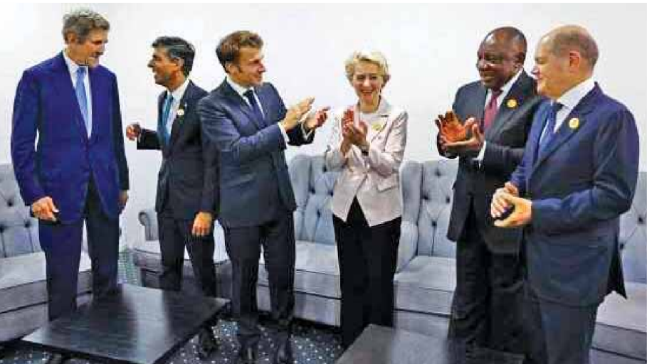
For the first time, delegates at this year's U.N. Climate conference are to discuss demands by developing nations that the richest, most polluting countries pay compensation for damage wreaked on them by climate change, which in climate negotiations is called "loss and damage."

World leaders are making the case for tougher action to tackle global warming Tuesday, as this year's international climate talks in Egypt heard growing calls for fossil fuel companies to help pay for the damage they have helped cause to the planet.