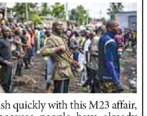
ish quickly with this M23 affair, because people have already fled their homes and others are confined in camps without humanitarian assistance."

Congolese fighter jets began bombing rebel targets Tuesday in the country's embattled east, escalating its fight against the M23 group that the government alleges has been advancing with help from neighbouring Rwanda.