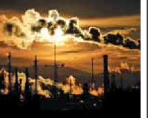
20% of France's national greenhouse gas emissions. Some 50 industrial sites in France, which account for over half of these emissions, are owned by about 30 French and international groups.

Just back from the U.N. Climate summit in Egypt, French President Emmanuel Macron is to meet Tuesday with the heads of the country's most climate-damaging industries to pressure them to reduce greenhouse gas emissions.