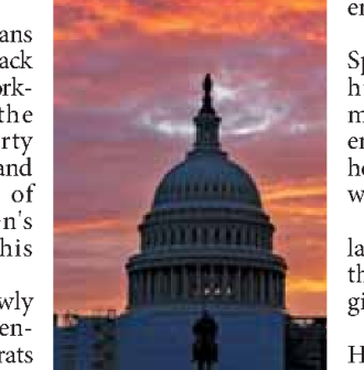
attack on the Capitol, and emotions are raw. The violent assault on Speaker Nancy Pelosi's husband has stunned many, and federal law enforcement is warning of heightened threats nationwide.

Energised Republicans are eager to claw back power in Congress, working to break the Democrats' one-party hold in Washington and putting the future of President Joe Biden's agenda at stake this Election Day.