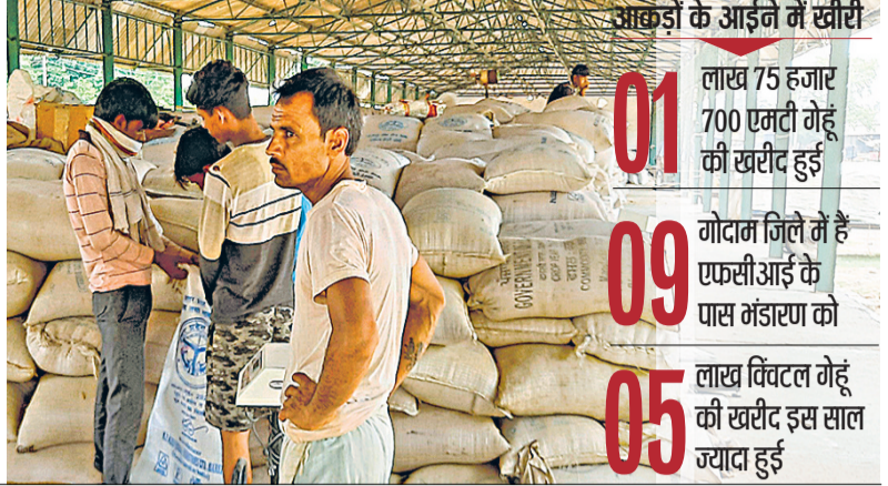
शाहजहांपुर 10 साल से बंद गोदाम खोला गया

गेहूं क्रय केंद्रों पर खुले आसमान के नीचे पड़ा है। लखीमपुर खीरी में गेहूं की बंपर खरीद के कारण भंडारण की समस्या उत्पन्न हो गई है। सभी सरकारी गोदाम फुल हो चुके हैं। भंडारण के लिए प्राइवेट गोदामों की तलाश की जा रही है। कन्नौज में क्रय केंद्रों पर भंडारण की दिक्कत के कारण गेहूं खरीद रोक दी गई है। जलालाबाद केन्द्र पर गेहूं के बोरे खुले में रख दिए गए हैं। यहां बारिश में गेहूं भीगने की शिकायतें आ रही हैं। हरदोई में 20 हजार मीट्रिक टन गेहूं अभी भी क्रय केंद्रों पर है। मेरठ में एफसीआई के गोदाम फुल हो चुके हैं, इसलिए कुछ गेहूं हापड़ के गोदाम में रखा पड़ा। वहीं सहायनपुर में भी गोदाम फुल हैं, जिसके चलते भारी मात्रा में गेहूं अभी भी क्रय केंद्रों पर पड़ा है। मुरादाबाद में सभी सरकारी गोदाम फुल हो चुके हैं।