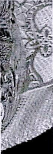
ज़िए सोने का फेस