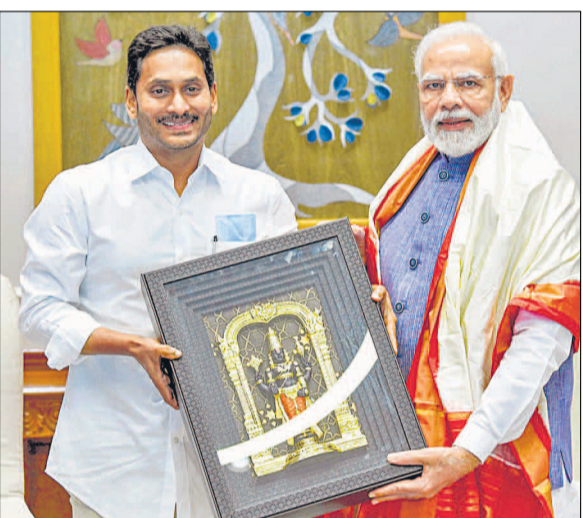
नई दिल्ली में सोमवार को आंध्र प्रदेश के मुख्यमंत्री वईएस जगन मोहन रेड्डी ने प्रधानमंत्री नरेंद्र मोदी से मुलाकात कर उन्हें स्मृति चिह्न भेंट किया।

केंद्र प्रधानमंत्री से 55,548.87 करोड़ रुपये के संशोधित लागत अनुमानों को मंजूरी देने की पिछले कुछ समय से मांग करते रहे हैं। मुख्यमंत्री का तर्क है कि राज्य सरकार राहत और पुनर्वास को आगे ले जाने की स्थिति में नहीं है क्योंकि इसमें बहुत अधिक खर्च है। इससे पहले, पोलावरम सिंचाई परियोजना की लागत 35,000 करोड़ रुपये थी। इस परियोजना का लक्ष्य 2.91 लाख हेक्टेयर भूमि पर सिंचाई, 960 मेगावाट बिजली का उत्पादन करना है।