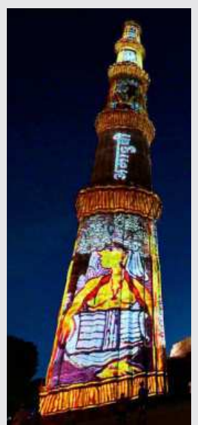
TACKY MAKEOVER. The Qutub Minar has been decked up with colourful lightings. KAMAL NARANG

An Archeological Survey of India (ASI) representative stated that there was no specific mandate to uplift all of the city's monuments. ASI undertook extensive