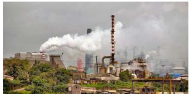
CALL FOR REASON. Revenues collected by EU on imports from India should be repatriated to India to use for its climate objectives' PH

During a meeting held earlier this week, it was said that India is compliant with