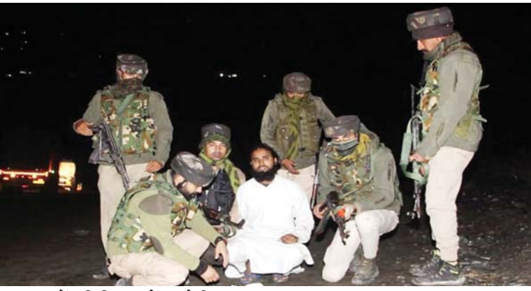
सुरक्षाबलों की गिरफ्त में आरोपी।