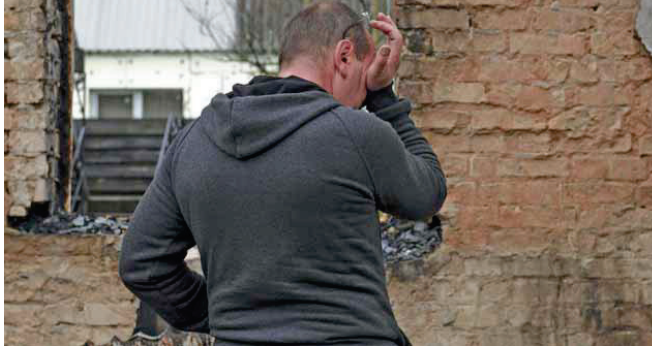
country's power system, the Ukrainian government strains to carry out the most urgent repairs to civilian residences.

Nearly USD 350 billion is needed for reconstruction across the war-ravaged country, and that amount is expected to grow, according to a report issued in September by Ukraine's government, the European Commission and the World Bank. Burdened with the fighting and frequent Russian attacks on