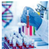
This is the first time in the world that red blood cells that have been grown in a laboratory have been given to another person as part of a trial into blood transfusion, they said.

It can be difficult to find enough well-matched donated blood for some people with these disorders, they said. The team, including researchers from the University of Cambridge in the UK, said the blood cells were grown from stem cells from donors. The red cells were then transfused into healthy volunteers.