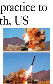
North Korea's military said on Monday its recent barrage of missile tests were practices to "mercilessly" strike key South Korea and US targets such as air bases and operation command systems with a variety of missiles that likely included nuclear-capable weapons.

The recent corresponding military operations by the 572 Korean People's Army are a clear answer of (North Korea) that the