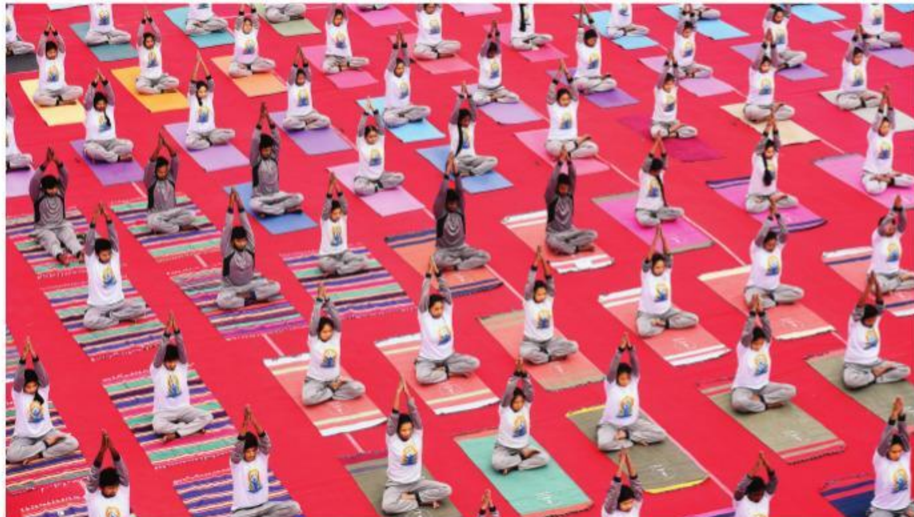
9-ஆவது சர்வதேச யோகா தினத்தை முன்னிட்டு சென்னை அரும்பக்கம் அரசு போகா மற்றும் இயற்கை மருத்துவக் கல்லூரி மருத்துவமனையில் யோகாசபை பயிற்சியில் ஈடுபட்டோர்.