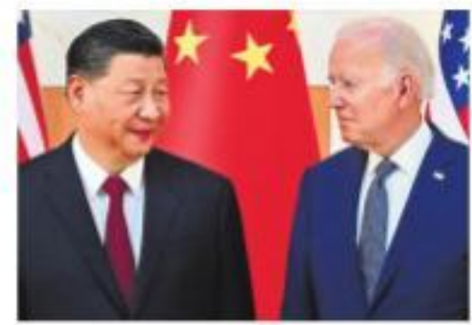
File image of Joe Biden (R) and Xi Jinping (L) on the sidelines of the G20 Summit in Nusa Dua on the Indonesian resort island of Bali on November 14, 2022

Mao reiterated China's contention that the balloon was for meteorological research and