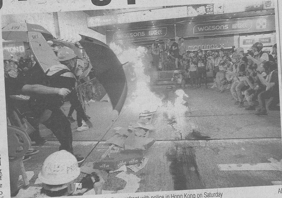
Protesters burn cardboard to form a barrier as they confront with police in Hong Kong on Saturday

But many say those rights are being curtailed, citing the disappearance into mainland custody of dissident book-sellers, the disqualification of prominent politicians and the jailing of pro-democracy