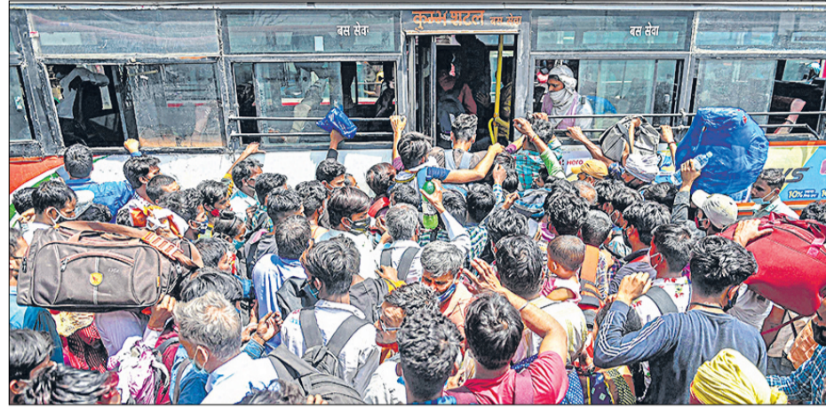
लखनऊ में बढ़ते कोरोना वायरस के चलते मंगलवार को आलमबाग बस अड्डे पर घर जाने वालों की भीड़ रही।

देश भर में 1.5 करोड़ से ज्यादा लोग संक्रमित : देश में महामारी के कुल संक्रमित होने वालों की संख्या 1,55,93,379 है, जिसमें से 1,82,379 लोगों की मौत हो चुकी है।