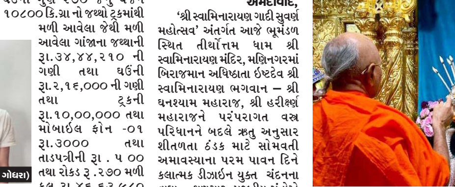
(શ્રી સ્વામિનારાયણ મંદિર, મહિનગર)

અમદાવાદ, 'શ્રી સ્વામિનારાયણ ગાદી સુવર્ણ મહોત્સવ' અંતર્ગત આજે ભૂમંડળ સ્થિત તીર્થોત્તમ ધામ શ્રી સ્વામિનારાયણ મંદિર, મહિનગરમાં બિરાજમાન અધિષ્ઠાતા ઈષ્ટદેવ શ્રી સ્વામિનારાયણ ભગવાન - શ્રી ધનશ્યામ મહારાજ, શ્રી હરીશ્વર મહારાજને પરંપરાગત વસ્ત્ર પરિધાને બદલે ઋતુ અનુસાર શીતળતા ઈડક માટે સોમવતી અમાવસ્યાના પરમ પાવન દિને કલાત્મક ડીઝાઈન યુક્ત ચંદના વાદ્ય - શણગાર પૂજનીય સંતોએ ધારણ કરાવ્યા હતા.