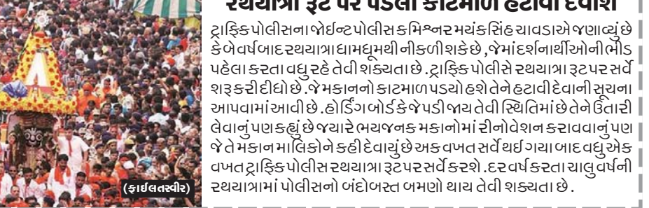
(શ્રી સ્વામિનારાયણ મંદિર, મહિનગર)