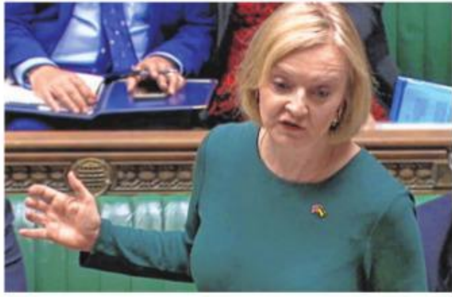
than two years.

Business and public institutions like hospitals and schools will also get support, but for six months rather