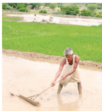
A normal monsoon is beneficial for the rural economy and helps drive the consumption of packaged goods.

Skymet, however, said that distribution of rainfall over more populous states such as Maharashtra, Madhya Pradesh and Uttar