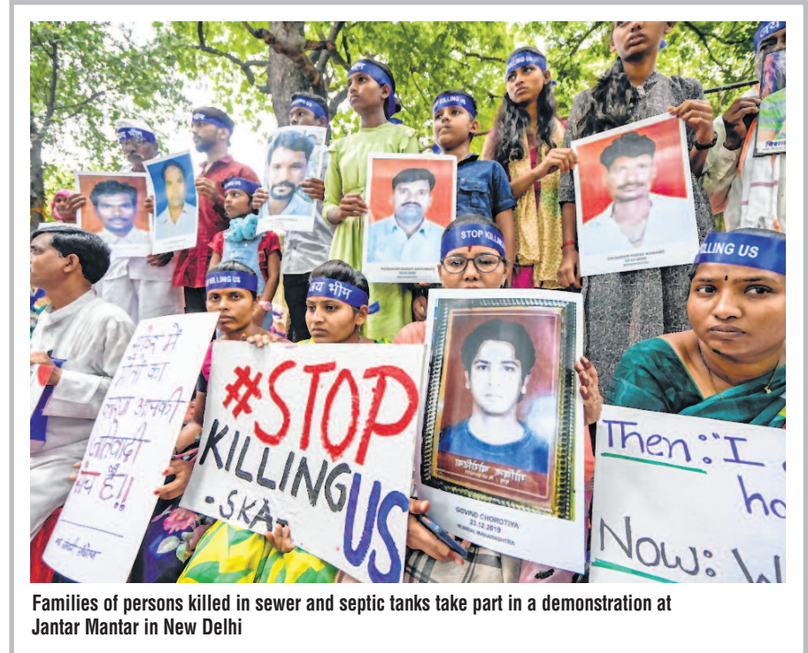
Families of persons killed in sewer and septic tanks take part in a demonstration at Jantar Mantar in New Delhi